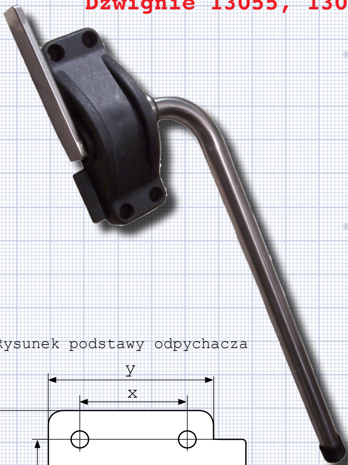
Rysunek podstawy odpychacza